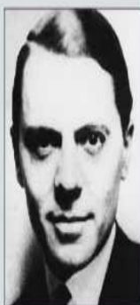
Jean Moulin, héros de la Résistance